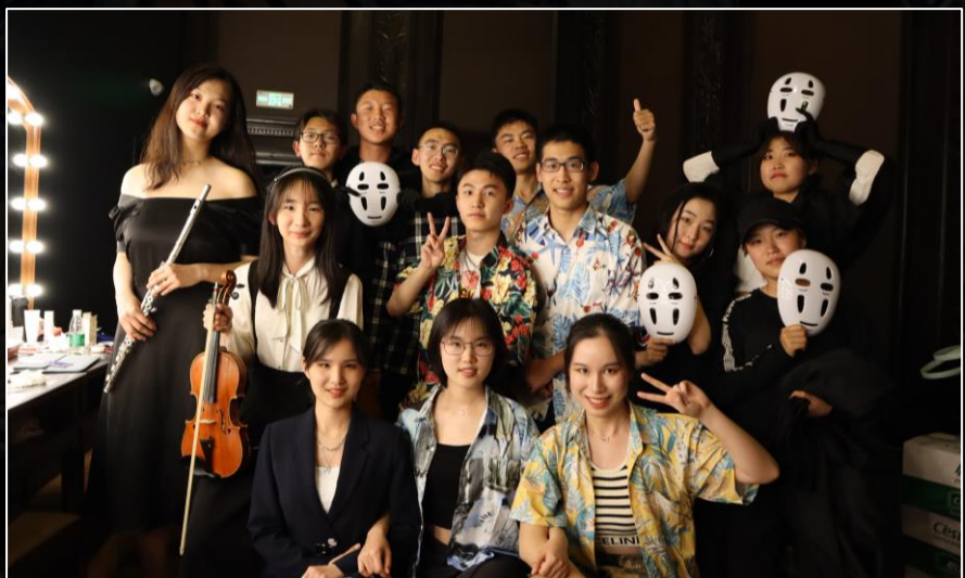
计算机系学生节 出演班级节目