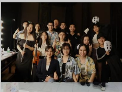
班级总结推被学院公众号转载