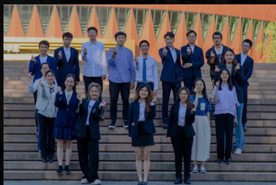
经管学院学生会联络部