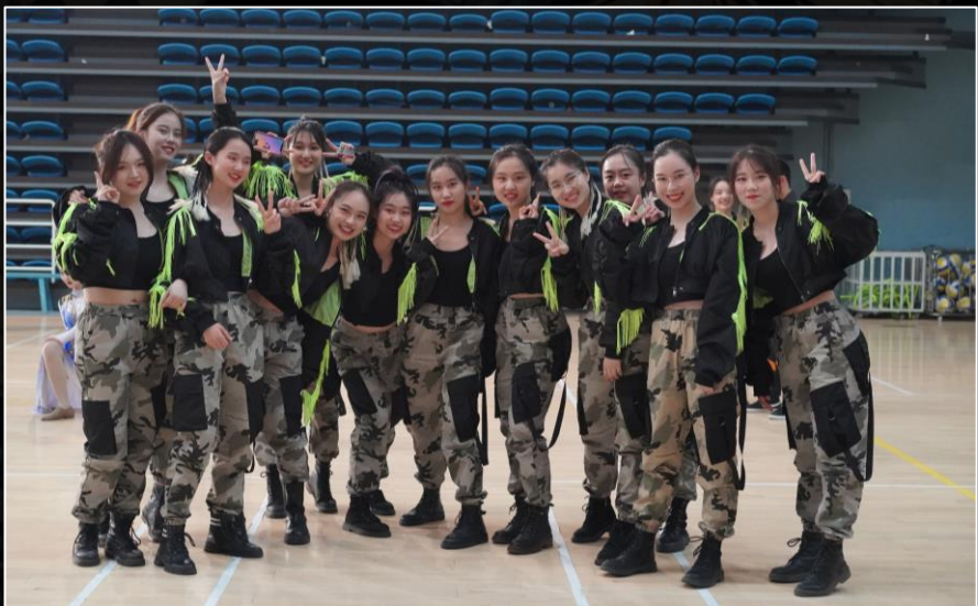
计算机系啦啦操队 马杯比赛