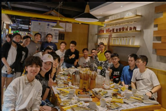
经12-计18 中秋 团建